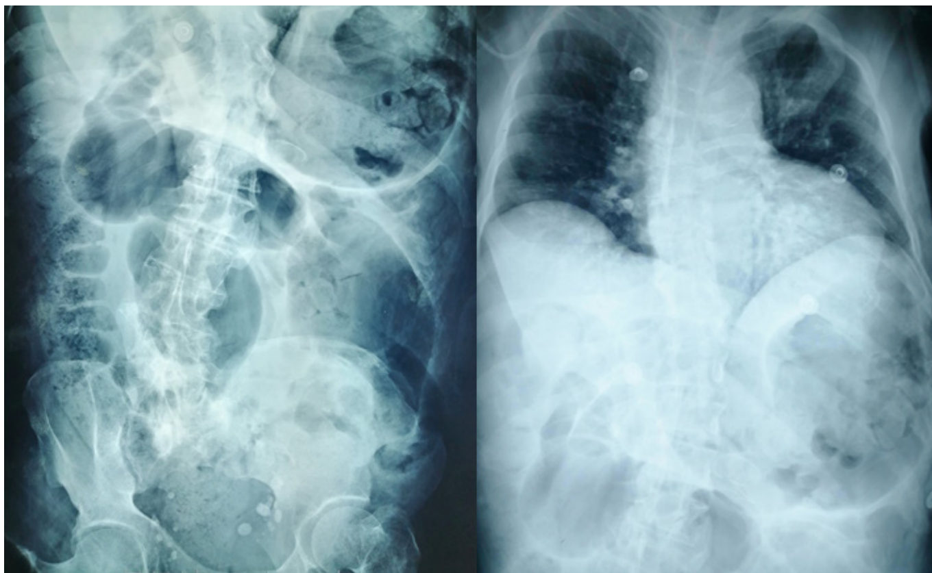
Figura 1. Serie abdominal presenta asas intestinales distendidas con nivel hidroaéreo sin gas distal

una infección y produciendo gas por mecanismos aún no esclarecidos 3 .